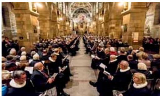
Vue over Viborg Domkirke under reformationsgudstjenesten 31. oktober 2017.

Nærmere omtale og billeder af den festlige begivenhed kan ses på Viborg Stifts hjemmeside.