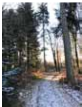
Lyset er på vej

På menighedsrådsmøde den 21. januar 2021 er det besluttet, at for fremtiden faktureres der forud for faste aftaler om