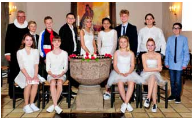
Konfirmanderne i Thorning 13. maj 2018. kl. 11.00.