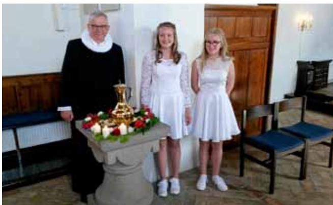
Konfirmanderne i Grathe kirke 6.maj 2018 kl 10.00.

Forsamlingshus, hvor vi indtager en let anretning, og efterfølgende er der informationer om årets konfirmationsforberedelse, vigtige datoer, arrangementer mv. Vi slutter af med en kop kaffe og en sang! Arrangementet forventes at slutte kl ca 19.00.