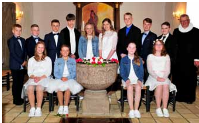
Konfirmanderne i Thorning 13. maj 2018 kl. 9.00.