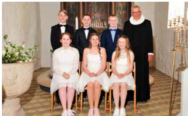
Konfirmanderne i Vium 12. maj 2018 kl 10.00.