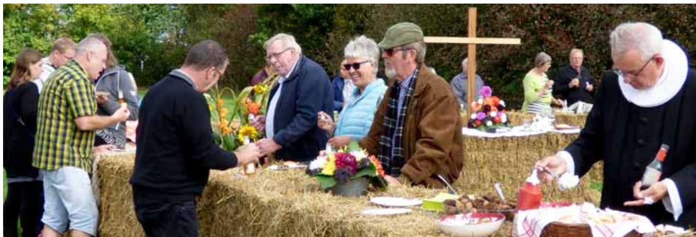
Halballekirkens vægge fungerede fint som buffet efter høstgudstjenesten i Gråmose den 18. september.